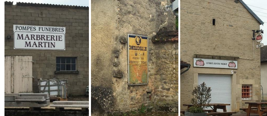
Diversité des enseignes de façades à Chassigny