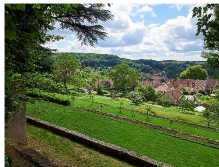
Jardins suspendus de Cohons