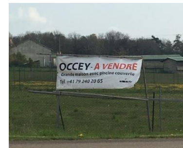
Occey : Publicité démesurée