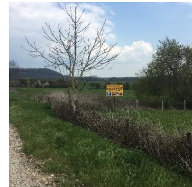
Verailles-le-Haut : Publicité en milieu rural ouvert