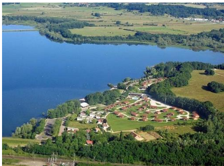
Lac de la Vingeanne

En matière de tourisme, la CCAVM est parcourue par des boucles cyclo-touristiques ainsi que des itinéraires locaux de randonnées. Le tourisme s'est en effet construit autour du patrimoine naturel particulièrement favorable aux activités de pleine nature. Majoritairement destiné à un usage touristique, ces cheminements constituent la voirie piétonne et cyclable du territoire. L'image et la notoriété du territoire se sont également constituées au travers du tourisme culturel.