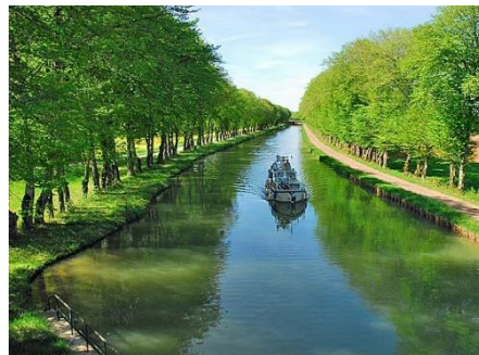
Canal entre Champagne et Bourgogne