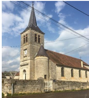
Le Val D'Esnoms

Le territoire de la CCAVM concentre un patrimoine bâti et une architecture identitaire, témoins de l'histoire du territoire et des activités passées, cette richesse participe à la qualité du cadre de vie. Outre les sites inscrits ou classés, le territoire compte également de 13 monuments historiques classés et 63 inscrits ou partiellement inscrits ou classés).