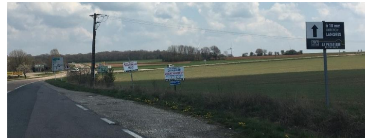
Flagey : Diverses publicités le long de la RD428